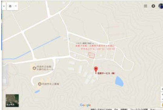
《太陽光パネル配置モデル図》