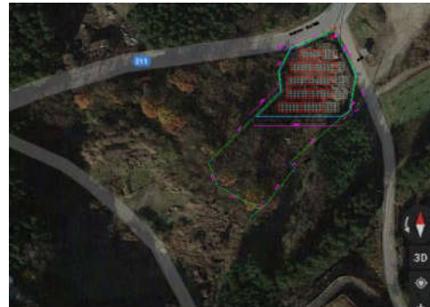
《配置イメージ写真》