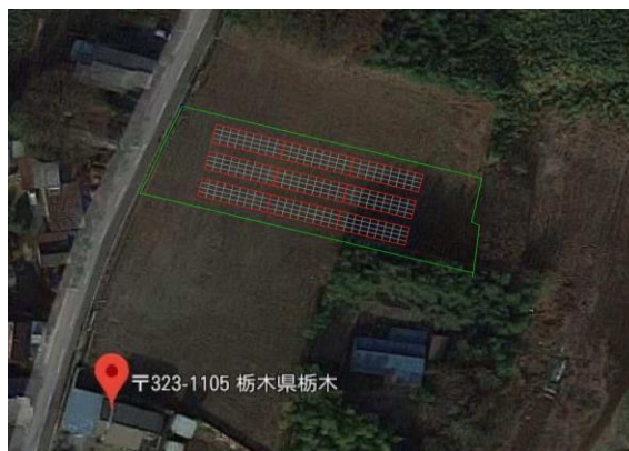
《配置イメージ写真》