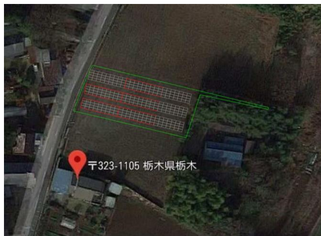
《配置イメージ写真》