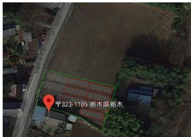
《配置イメージ写真》