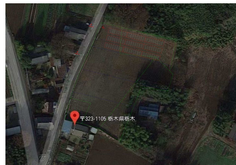
《配置イメージ写真》