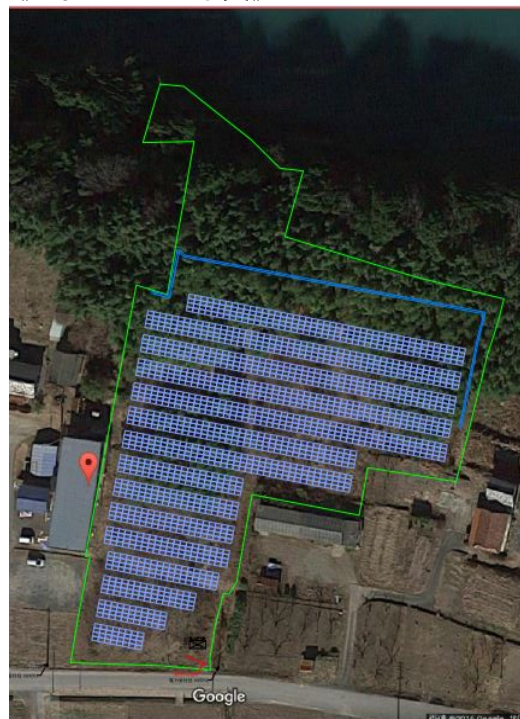
《配置イメージ写真》