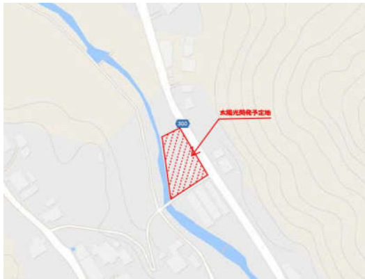
《太陽光パネル配置モデル図》