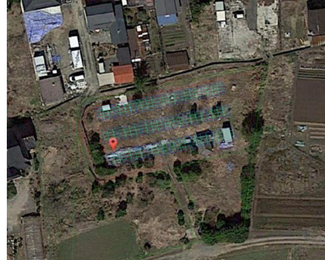
《配置イメージ写真》